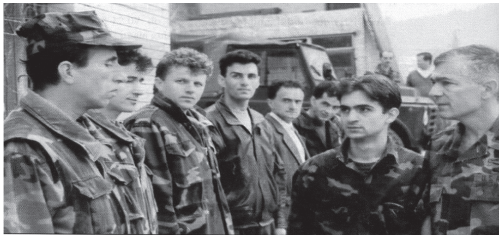
Posjeta generala Klarka, Vojska S.A.D.-a Komandi 1. bataljon 101. mtr.

Rukopis knjige „Naša 101. brigada“ zavređuje izvanrednu pažnju šire čitalačke publike, posebno iz razloga što ova knjiga predstavlja svojevrsni historiografski dokumentar i upotpunjuje ukupnu sliku stanja u Sarajevu i Bosni i Hercegovini u periodu 1992-1995.